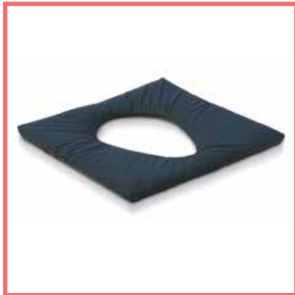
Cuscino con foro