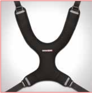
Pettorina sternale PRO