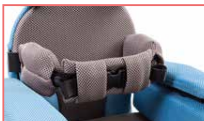
Fascia supporto tronco