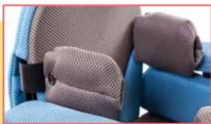
Supporti laterali tronco