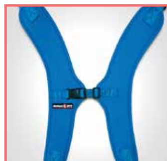
Stabilizzatore ad H