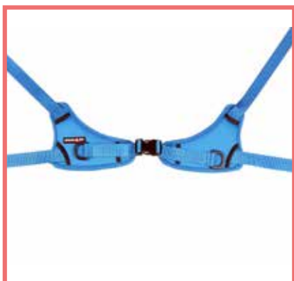
Antirotazione del bacino