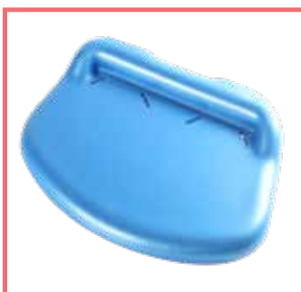
Imbottitura pedana unica